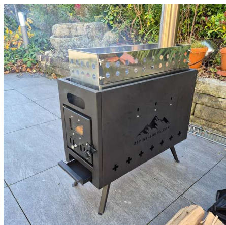
Processus de rodage