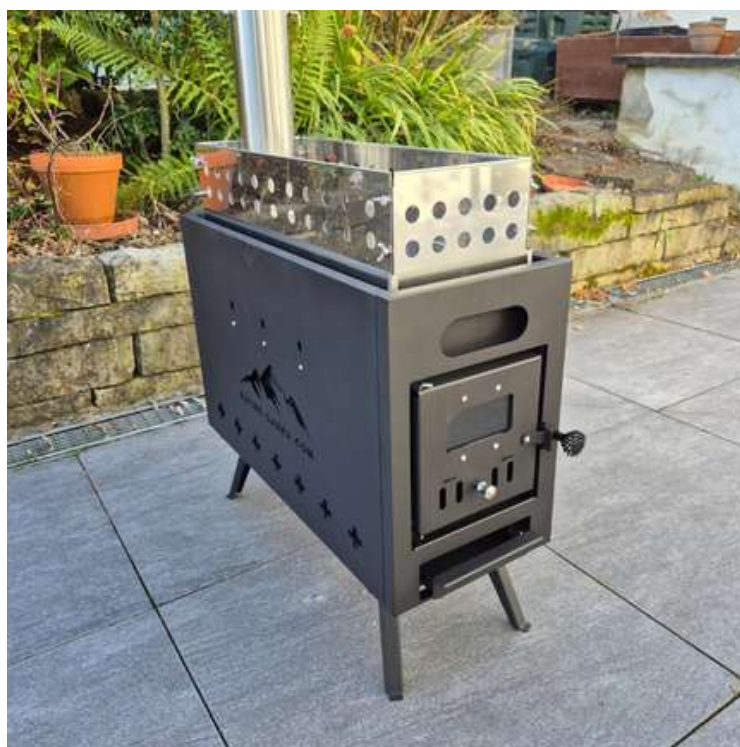
Poêle de sauna assemblé