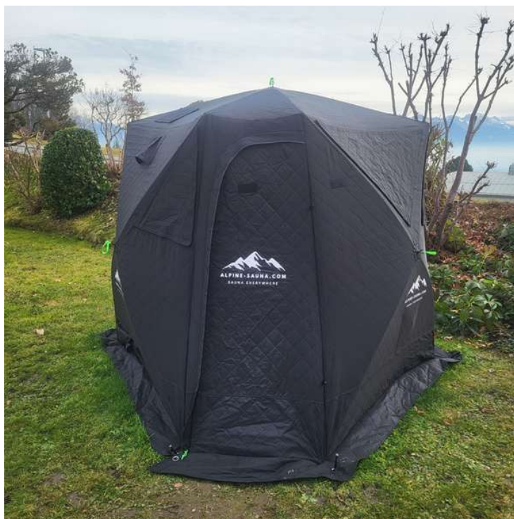
Tente de sauna montée